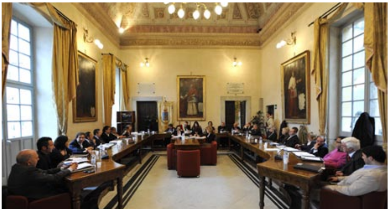
La prima seduta del nuovo Consiglio comunale